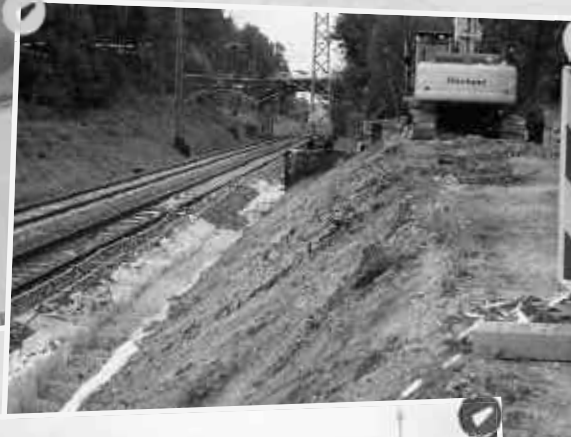
Die Deutsche Bahn saniert eine Gabionen-Stützwand an der Bahnhofstraße