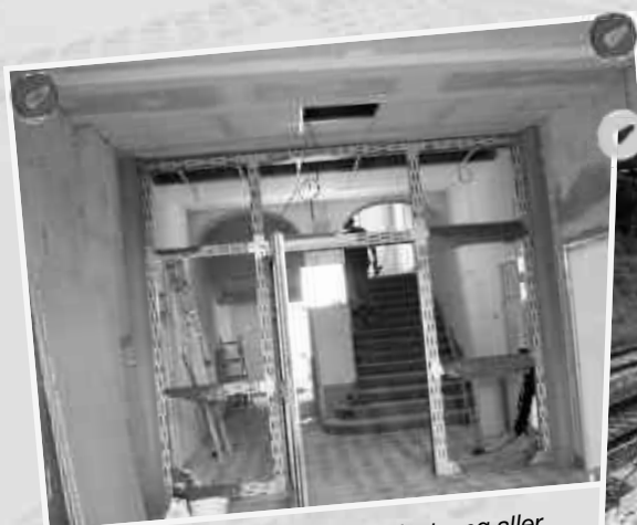
Brandschutztechnische Instandsetzung aller Etagen in der Grundschule Auerswalde