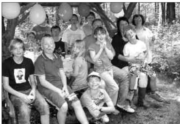
Unser Picknick nach einer erfolgreichen Schatzsuche

Auerswalder Str. 8 · 09244 Lichtenau · OT Oberlichtenau · Tel.: 037208/884481